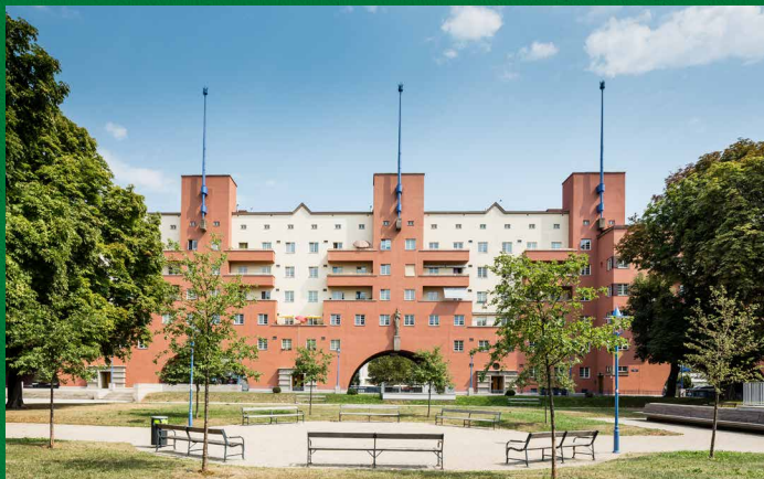
Karl Marx Hof, Wien