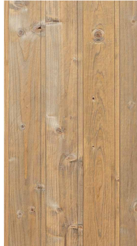
2 Nach 1 Woche