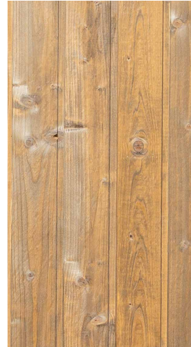
3 Nach 1 Monat